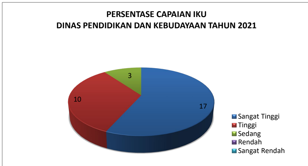
Gambar 3.1 Persentase Pencapaian IKU Dinas Pendidikan dan Kebudayaan tahun 2021

Berdasarkan skala nilai peringkat kinerja pada Peraturan Menteri Dalam Negeri Nomor 54 Tahun 2010 terdapat 18 indikator menunjukkan capaian sangat tinggi, 9 indikator menunjukkan capaian tinggi, dan 1 indikator menunjukkan capaian sedang.